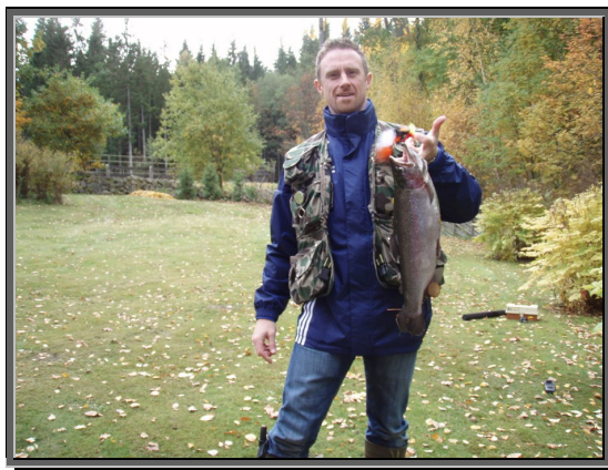
Även Anders är stolt över sin fisk efter en lyckad fiskedag.

Cross-carten som även undertecknad provade på var en riktigt rolig upplevelse. Att köra runt på en 1 km lång grusväg i skogen på en cross-utrustad gocart med målet att ha lägre varvtider än övriga kan få vinnarhornen att växa ut på vilken pappa som helst. Även barnen hade roligt trots att de inte hade gasen i botten hela tiden.